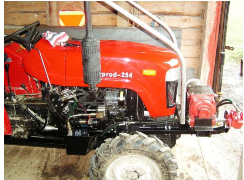
Åtgärd 14. Hydrauldriven frontvinsch. Manövreras från förarsäte alternativt vid vinsch.